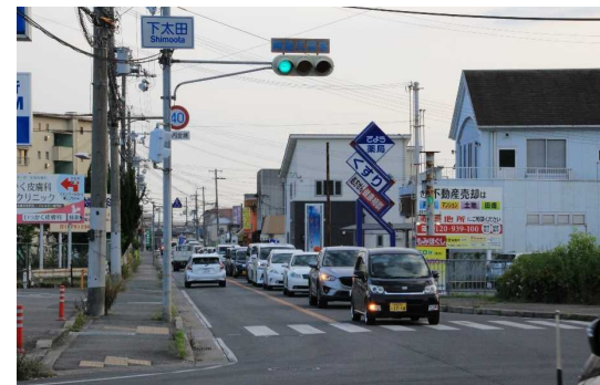
大江島太子線（下太田）