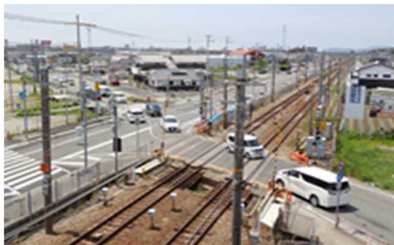
田寺今在家線（棚田）